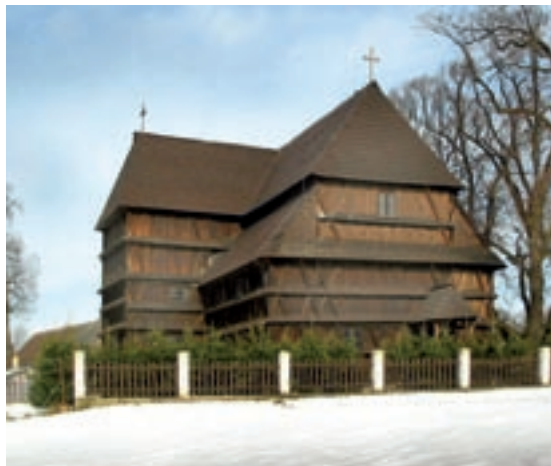
Hronek, evanjelický artikulárny kostol

Pri orientácii, ktoré predmety patria do tejto skupiny, je najlepšou pomôckou materiál, ktorý bol odovzdaný v rokoch 1993 až 1995 proti podpisu každému správcovi sakrálného objektu vtedajším Pamiatkovým ústavom (tzv. Celoplošná fotodokumentácia, realizovaná pamiatkarmi v spolupráci s policajným zborom). Ďalší exemplár tohto materiálu sa nachádza v príslušnom KPÚ. Materiál obsahuje identifikačné listy nielen všetkých hnutelných kultúrnych pamiatok