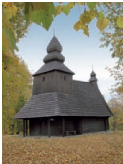
Ruská Bystrá, Kostol sv. Mikuláša

Informácie o tom, či je objekt evidovaný ako národná kultúrna pamiatka, možno získať na webovej stránke PÚ SR www.pamiatky.sk alebo e-mailom na adrese: uzkp@pamiatky.gov.sk .