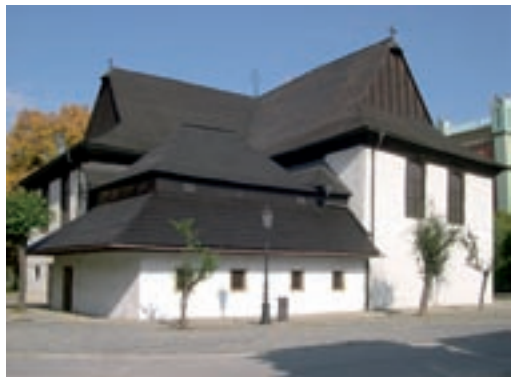
Kežmarok, evanjelický artikulárny kostol

Žiadosť o dočasný vývoz kultúrnej pamiatky predkladá žiadateľ na predpísanom tlačive (tlačivo je možné získať na stránke ministerstva kultúry http://www.culture.gov.sk/kulturne-dedicstvo/ochrana-pamiatok/formulre alebo priamo na ministerstve, prípadne ho môže vlastníkovi poskytnúť príslušný KPÚ).