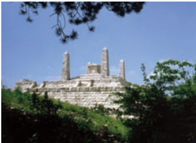
Mohyla generála Milana Rastislava Štefánika na Bradle

ktoré v spolupráci s domácimi a zahraničnými prispievateľmi podporujú formou grantov rozvoj v oblasti kultúry, umenia a architektúry, životného prostredia, ale aj rozvoj malého a stredného podnikania. Mnohé veľké firmy týmto aktivitami prostredníctvom zamestnanckých projektov prispievajú k obnove kultúrneho dedičstva. U každej nadácie a fondu platia vlastné pravidlá a časové harmonogramy, ktoré je potrebné rešpektovať.