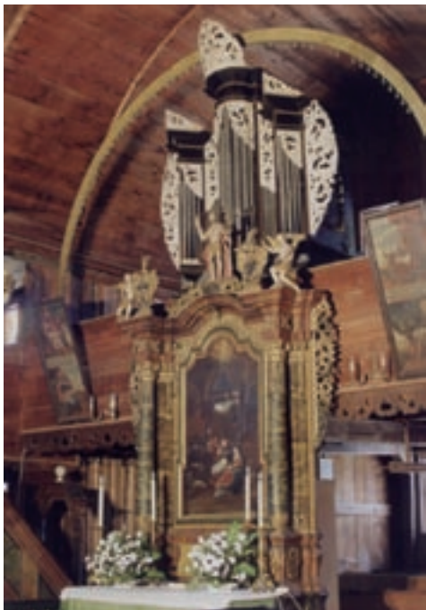
Interiér artikulórného kostola v Hronseku

Možný je iba jej dočasný vývoz na základe povolenia Ministerstva kultúry SR po predchádzajúcom vyjadrení pamiatkového úradu, najdlhšie na tri roky (najčastejšie ide o dôvod reštaurovania alebo vystavovania). Ministerstvo môže vydanie povolenie viazať na určité podmienky (napr. poisťná zmluva).