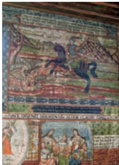
Hervartov, Kostol sv. Františka Asisského

K pamiatkovým hodnotám patrí nielen bezprostredné historické prostredie pamiatok. Súčasťou pamiatkového fondu sú aj pamiatkové územia. Ich základným znakom je zachovanosť priestorového a pôdorysného usporiadania t. j. ich urbanisticko-architektonická štruktúra . Ochrana územia s uceleným historickým sídelným usporiadaním a s veľkou