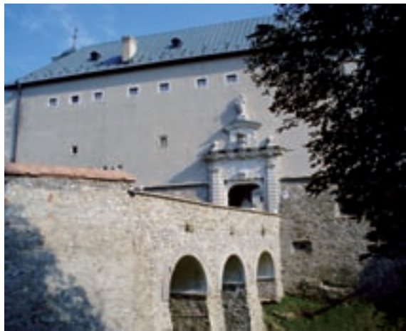
Častá, Hrad Červený Kameň

Proces vyhlasovania veci za súčasť pa- miatkového fondu začína podnetom, kto- rý môže podať každá fyzická a právnická osoba, pokračuje jeho odborným po- súdením v príslušných komisiách a inš- titúciách, spracovaním odborného pod- kladu a je zavŕšený vydaním rozhodnutia kompetentného úradu. Pri zmene a zru- šení vyhlásenia je postup primerane rovnaký. Spôsob tvorby pamiatkového fondu je presne uvedený v § 15 až § 21 pamiatkového zákona.