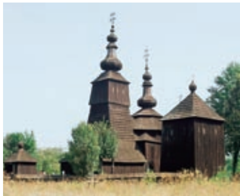
Ladomírová, Kostol sv. Michala archanjela

Oprávnení prijímatelia: verejné orgány a orgány, ktoré sa spravujú verejným právom a sú to orgány zodpovedné za ochranu kultúrneho dedičstva a krajiny.