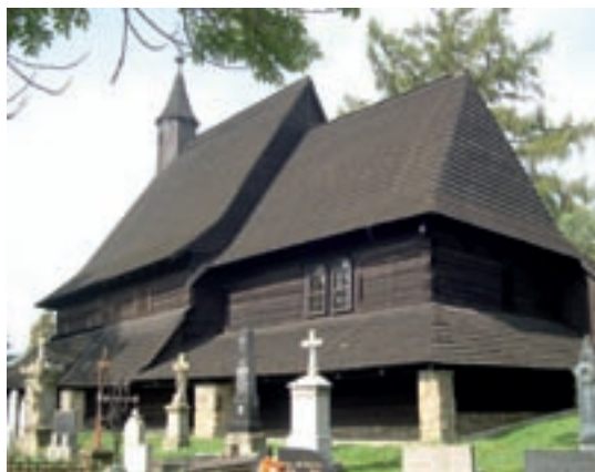
Tvrdošín, Kostol Všetkých svätých

Hnutelné kultúrne pamiatky sú centrálné evidované v PÚ SR v Ústrednom zozname pamiatkového fondu. V prvom rade je nevyhnutné, aby vlastníak poznal zverený cirkevný mobiliár. Na tento účel je nevyhnutné protokolárne a preukazne prebrať pri zmene správcu hnutelné vlastníctvo s pamiatkovými hodnotami.