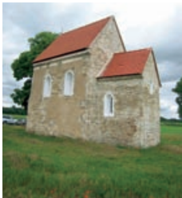
Koprčany, Kostol sv. Margity Antiochijskej

a o jeho činnosti od najstarších dôb, spravidla sa našla alebo sa nachádza v zemi, na jej povrchu alebo pod vodou. Archeologický nález je vlastníctvom Slovenskej republiky. Správcom archeologického nálezov je Pamiatkový úrad SR. Správcom archeologického nálezov môže byť tiež Archeologický ústav SAV alebo múzeum zriadené ústredným orgánom štátnej správy v prípade, ak ide o nález nájdený počas nimi vykonávaného archeologického výskumu. Archeologický výskum môže vykonať len oprávnená osoba na základe oprávnenia vydaného Ministerstvom kultúry SR. Pokiaľ sa archeologický nález nájde mimo výskumu a nálezca ho najneskôr do dvoch pracovných dní ohlásí príslušnému krajskému pamiatkovému úradu, má nálezca nárok na vyplatenie nálezného až do výšky 100 % hodnoty archeologického nálezov, ktorého hodnotu určuje znalecký posudok. Je však zakázané používať detekčné zariadenia ako aj vyzdvíhať archeologické nálezov zistené pomocou detektorov kovov, takéto konanie môže byť posudzované ako trestný čin.